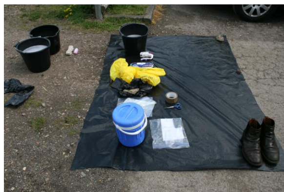
Punto de bioseguridad o desinfección en una zona limpia previo al ingreso a una explotación sospechosa.

De los tres pasos, el más efectivo y de mayor importancia es el de la segregación y control de tráfico . Si el VFA no entra en contacto con animales no infectados o con equipos no