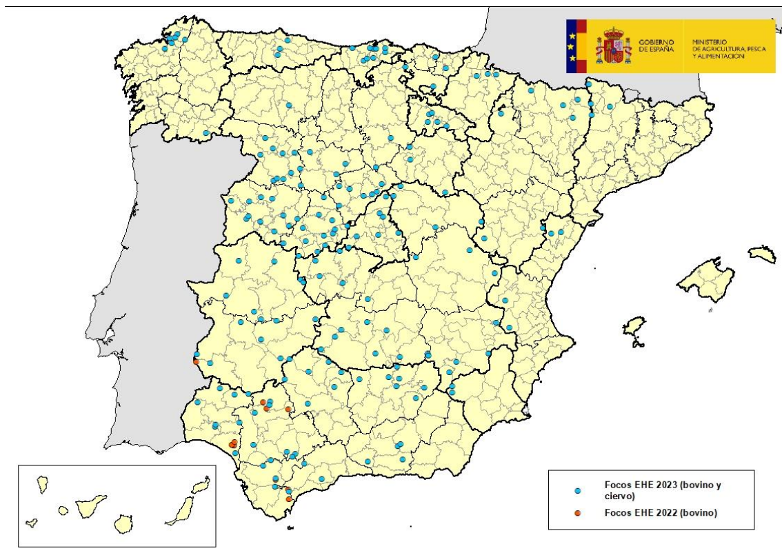
Mapa 1: Focos de EHE en España en años 2022 y 2023

Desde la última actualización sobre la enfermedad realizada el pasado 04 de octubre, el Laboratorio Central de Veterinaria (LCV) de Algete, laboratorio nacional de referencia para esta enfermedad, ha confirmado casos de enfermedad hemorrágica epizootica (EHE) en 9 nuevas comarcas. De ellos, 8 se han detectado en explotaciones de bovino en las comarcas de: Terra Cha Vilalba (Lugo); Cabezón de la Sal (Cantabria); Logroño (La Rioja); Valencia de don Juan (León); San Leonardo de Yagüe (Soria); Pallars Sobira (Sort) y Vall d'Aran (Vielha) (Lleida); Órgiva (Alpujarra/Valle de Lecrín) (Granada). Asimismo, se ha detectado 1 caso en ciervo en la comarca de Jaca (Huesca). Ver mapa 1.