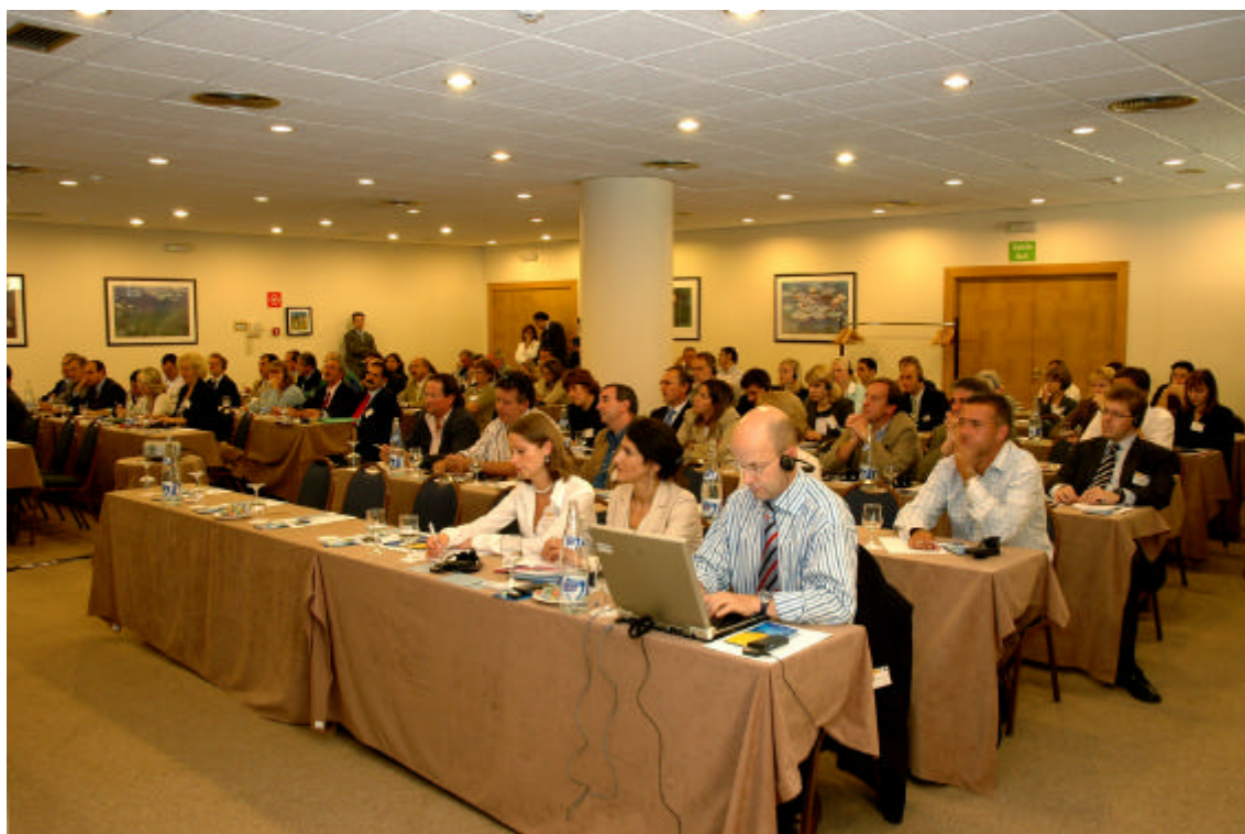
(De izqda. a dcha. en la primera fila, los miembros de la Comisión Europea: Ramune Genzbygelite, Nacira Boulehouat, y Dominique Leveil)