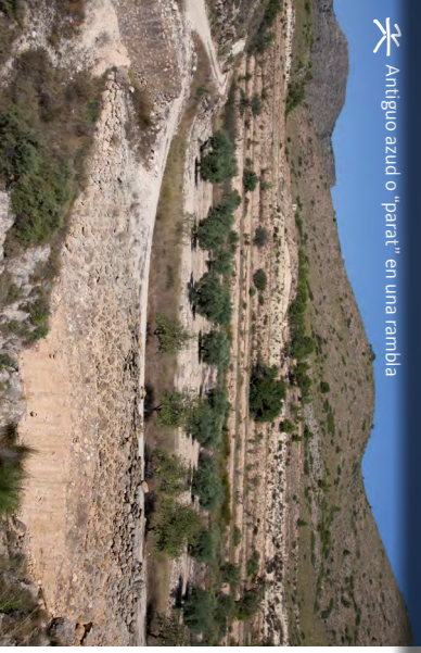
Antiguo azud o "parat" en una rambla