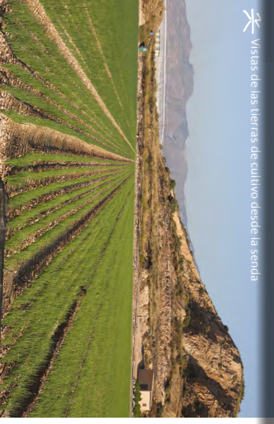
Vistas de las tierras de cultivo desde la senda

fuentes de abastecimiento de agua y una antigua mina.